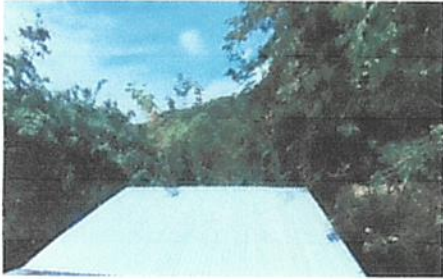
Foto 1: sustitución de lamina normal por lamina troquelada alusin calibre #26